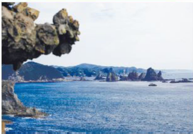
▲南伊豆町の「石廊崎」

自治体間交流は、自然豊かな地方の自治体との交流を通し、互いの生活に活力と潤いを育むことを目的に始まりました。自然体験や物産販売などを実施したり、災害時の協力体制を整えたりしながら、連携を深めています。